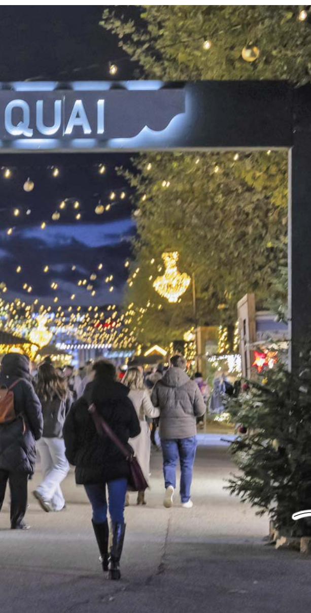
Noël au Quai, à Genève, déploie ses atours au bord du lac.